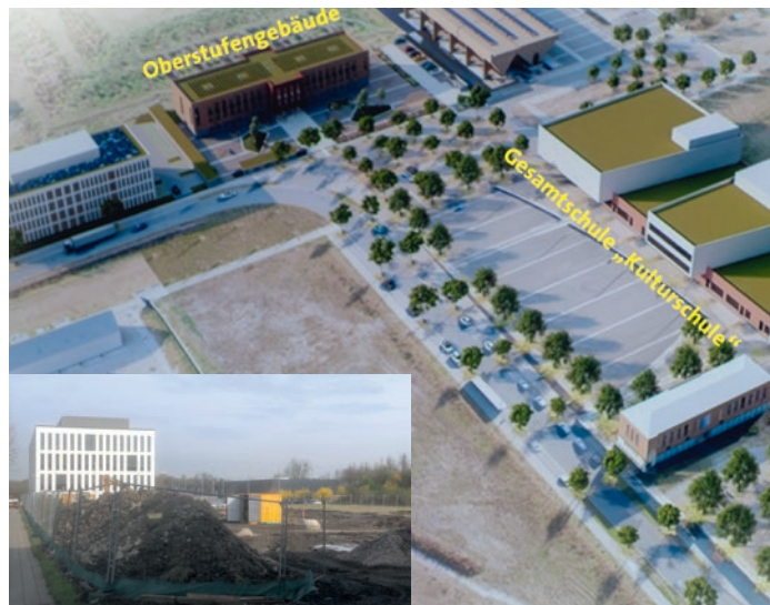
Bau des Oberstufengebäudes der „Kulturschule“ ist gestartet

Läuft: Bau des Oberstufengebäudes Kulturschule Stefanie Hugot, Leiterin Stadtplanung erläuterte den langen Weg vom ersten Bebauungsplan für die Gesamt-/Kulturschule auf dem Gelände „Schalker Verein“. Begonnen wurde jetzt mit dem Bau des sogenannten Oberstufengebäudes (s. Bilder). Hier sollen im Schuljahr 2025/26 erste Schüler*innen der späteren Gesamtschule (rechts im Bild) in das Gebäude einziehen. Die Fertigstellung des ge-