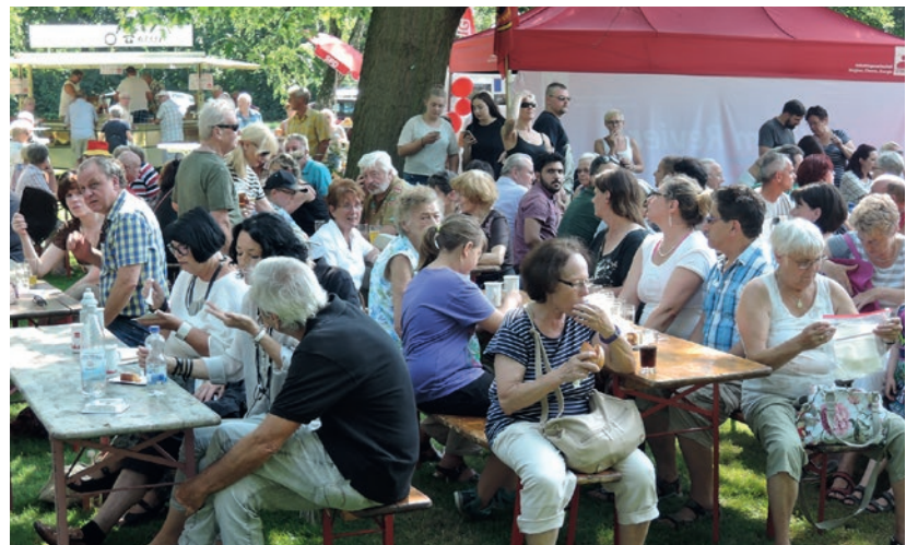
Gemütlich zusammensitzen im Bulmker Park beim Parkfest am 24. August 2024