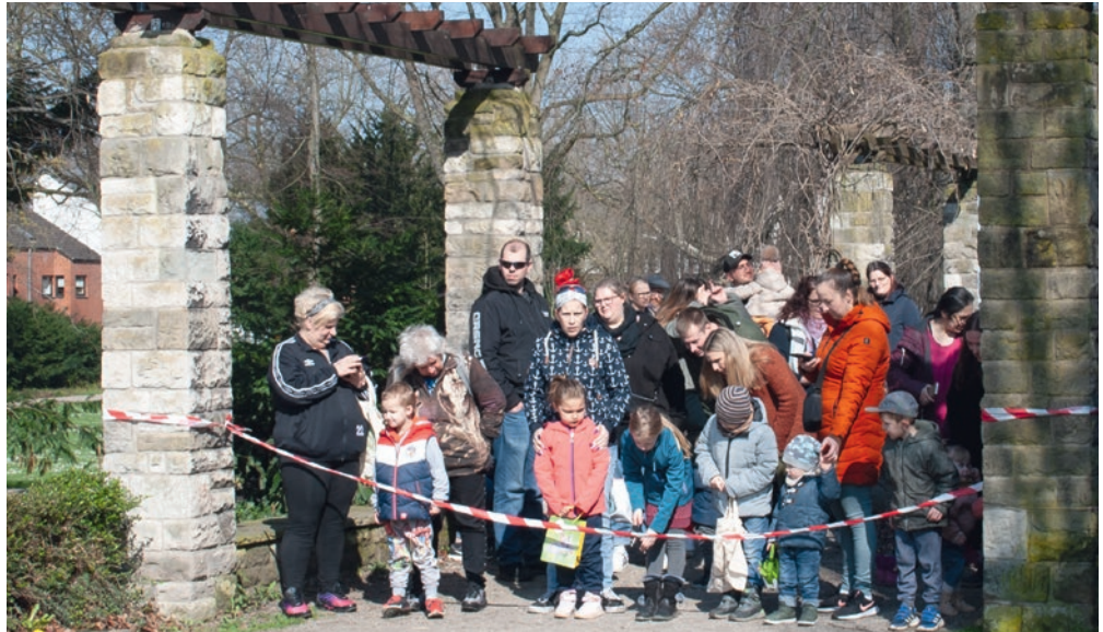
Spannung für die Vorschulkinder vor dem Start zur Osteraktion auf dem Bild aus dem Jahr 2023

Der Start zur Eiersuche ist pünktlich um 11 Uhr. (Zeitumstellung: Sommerzeit!) Das Flatterband zum Spielplatz/auf den Wiesen wird durchgeschnitten, und die Suche beginnt